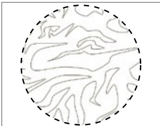
Porenstruktur bei nicht behandeltem Porensystem