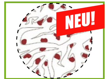
Porenstruktur nach dem neuen ISDAC® - Verfahren